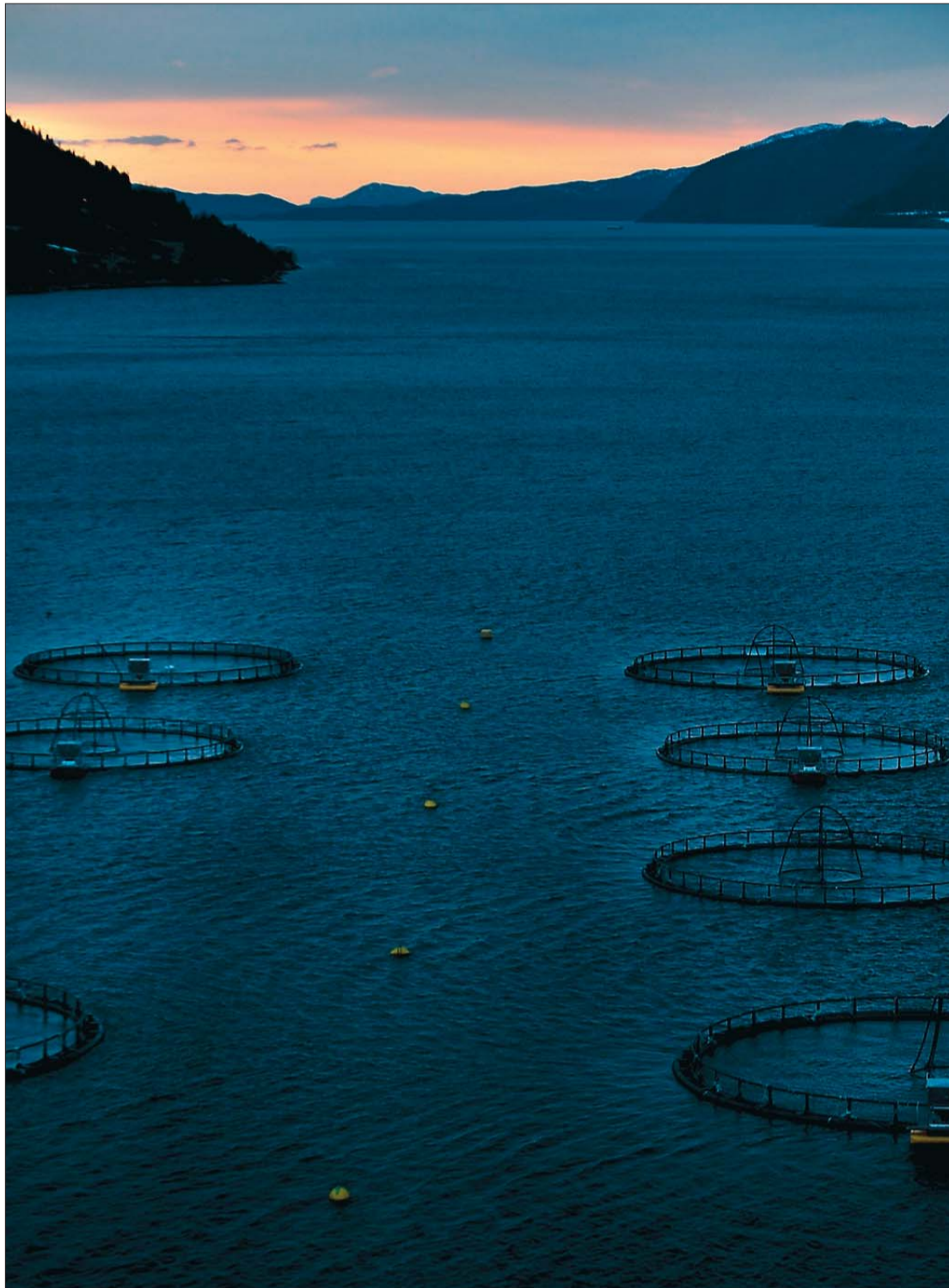
REINSING. Oppdrettsanlegg kan føre til overgjødning av fjordar, men det kan vere ei lysning i det fjerne. Ved å plante tare i og ved anlegga, kan ein oppnå ein reinseeffekt.

Mellom anna vil oppdrett på ein slik måte krevje utvikling av teknologi, alt frå potensielle gründerar til etablert utstyrsleverandørar kan finne mulegheit her. Integrert akvakultur vil også vere ein ny tanke for alle som driv forvaltning og politikk rundt oppdrett.